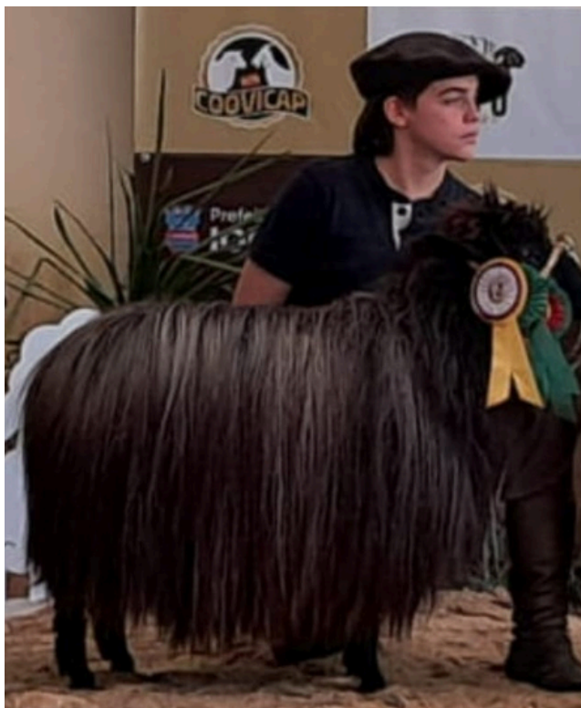
Terceira Melhor Fêmea na 8ª Exposição Nacional da Raça/Iomerê 2024 - ETA Pampiana 26

Isto os incentiva a buscarem e manterem valores pessoais e profissionais cada vez melhores.