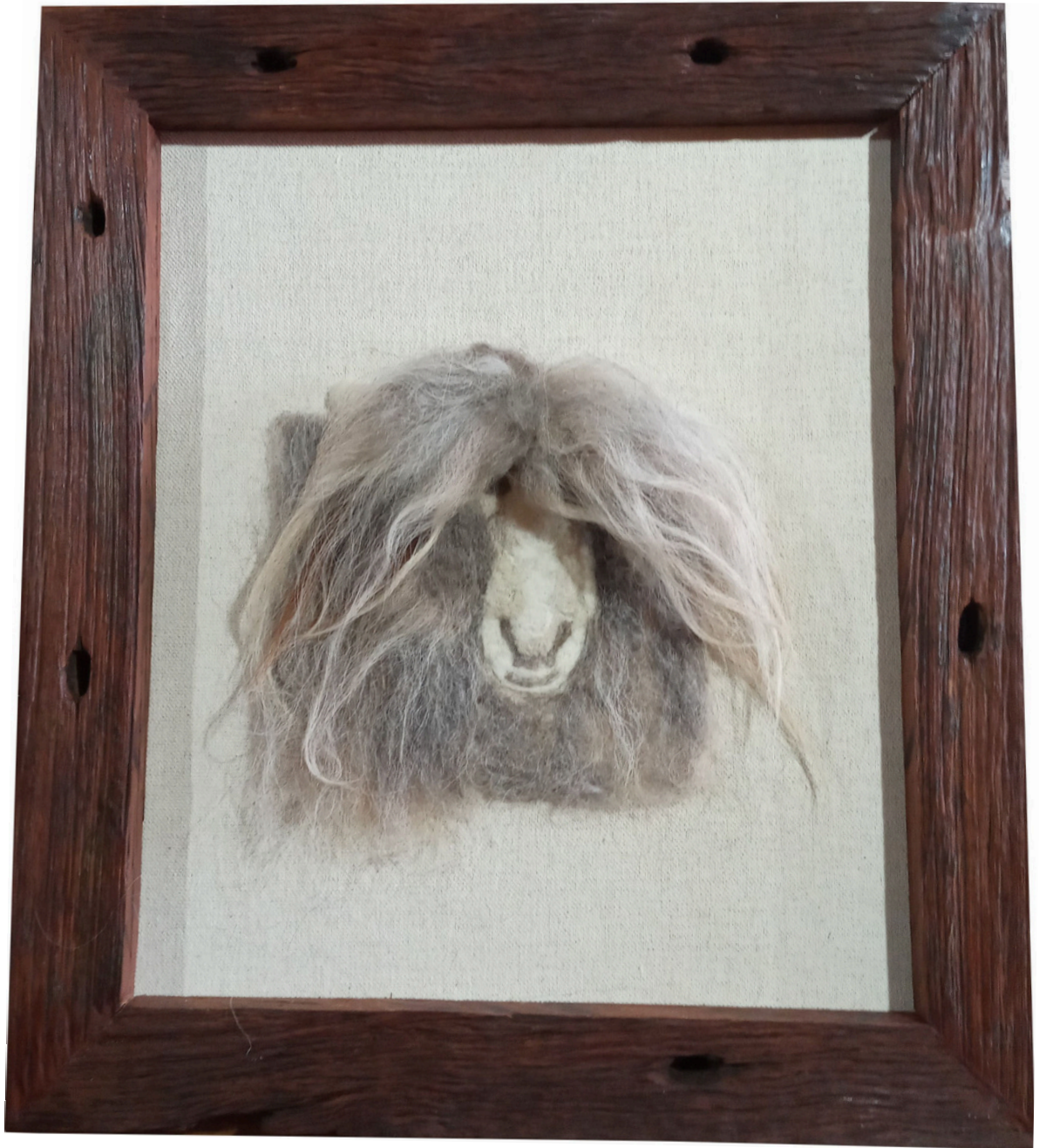
Feltragem com agulha A.C. Cassal. Bagé. 2024.