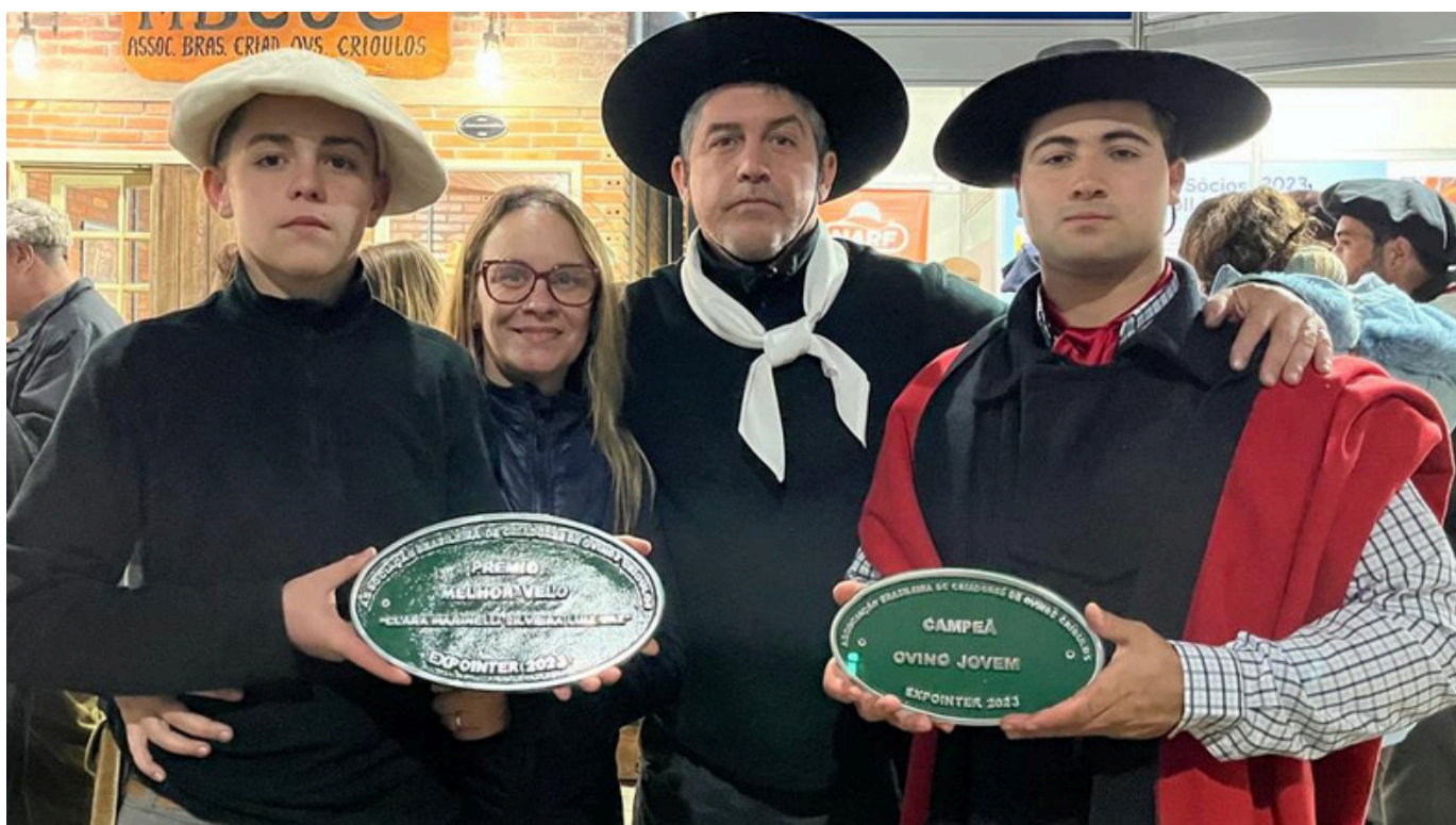
Premiações Expointer 2023 Melhor Velo e Campeã Ovino Jovem.

São aproximadamente 600 refeições servidas diariamente, já que contamos com o regime de internato. Nossos recursos financeiros são poucos, mas continuamos buscando, de várias formas alternativas, conjugar educação, empreendedorismo e produção consciente e sustentável.