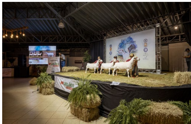
Leilão Sempre Referência alcançou faturamento de R$ 1.256.700