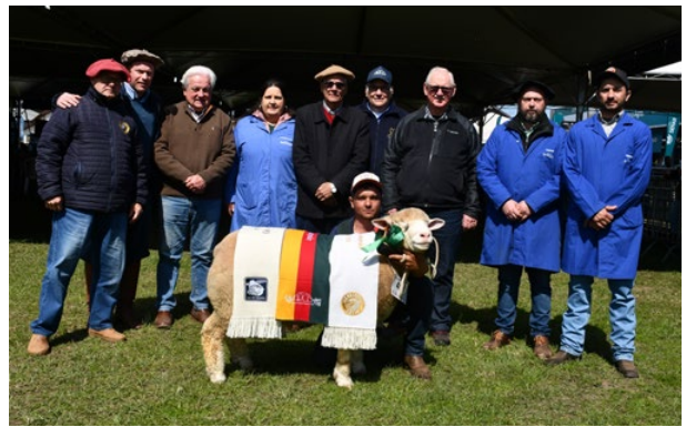
Grande Campeão Ile de France