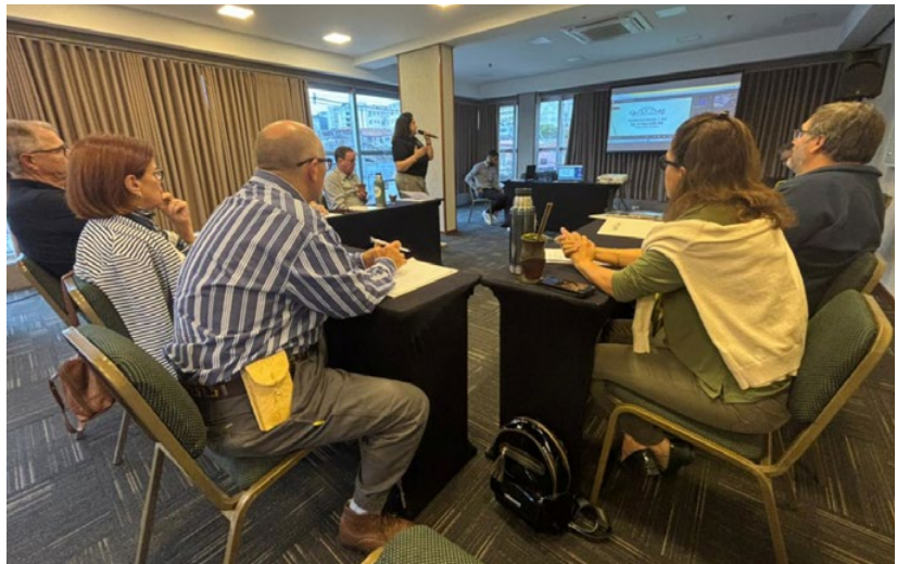
Reunião geral da diretoria, em Porto Alegre

Por fim, o presidente da Arco, Edemundo Gressler, disse que o grande desafio do setor em 2025 será o foco no aumento da produção de carne ovina. “Eu até falei para o ministro da Agricultura, Carlos Fávaro, em Brasília, que não queria ovinocultura na Amazônia. Nós temos que ter árvores na Amazônia, mas que as demais regiões do país possam ter uma ovinocultura forte.