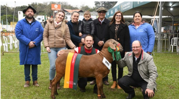
Grande Campeão Santa Inês