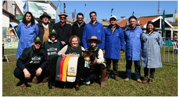
Grande Campeã Texel NCO