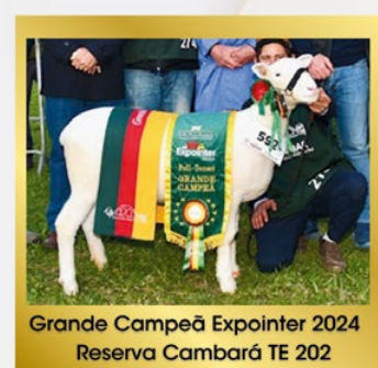
Grande Campeã Expointer 2024 Reserva Cambará TE 202

Prop: Cabanha King Star e Reserva do Cambará