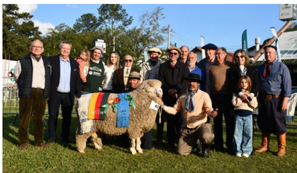
Grande Campeão Ideal