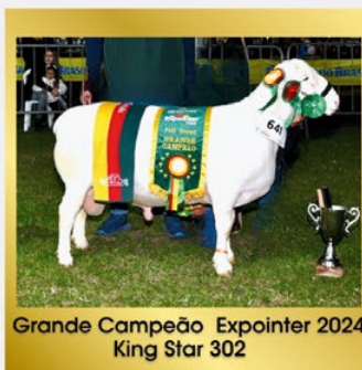
Grande Campeão Expointer 2024 King Star 302

@cabanhakingstar Curitiba - Paraná (41) 98841-6520