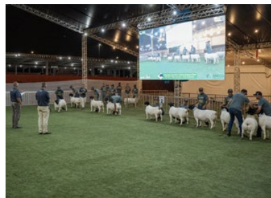
Pista movimentada na 17ª Nacional

expostos para venda. O evento reuniu 67 expositores da raça Dorper e 38 da White Dorper, com representantes de diversas regiões, de Norte a Sul do Brasil. Essa ampla participação deveu-se à localização estratégica da exposição, realizada na área central do país, fato que facilitou a presença e a troca de experiências entre os criadores.