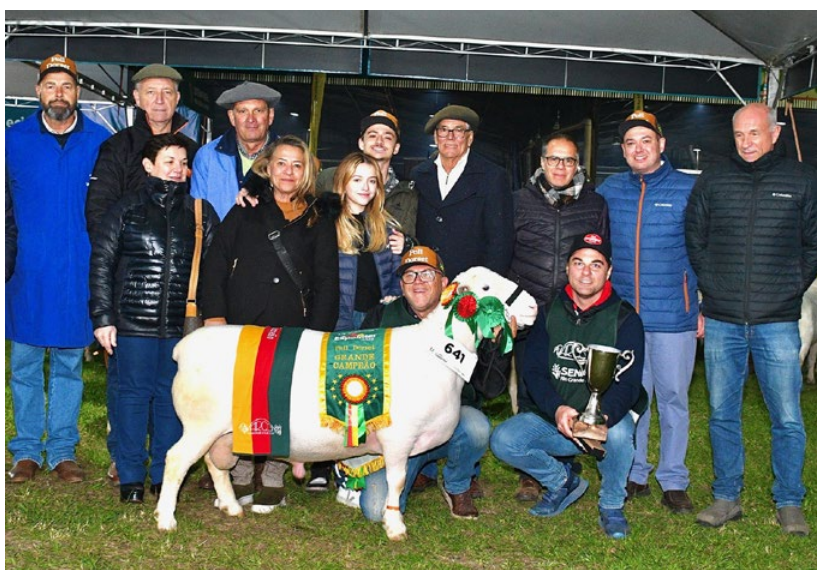
Grande Campeão King Star Daros TE 302