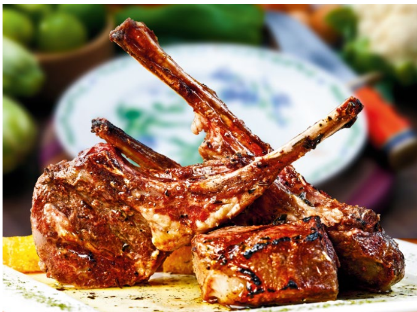
O consumo de carne ovina tem um grande potencial de crescimento no Brasil