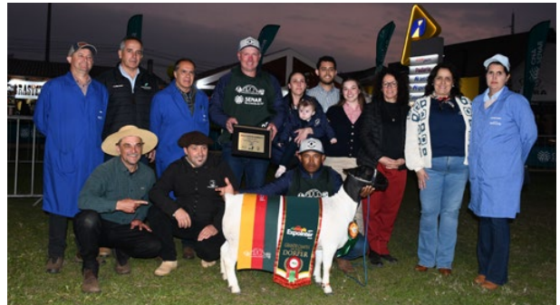
Grande Campeã Dorper