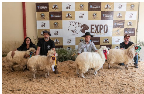
Campeonato Ovino Do Futuro