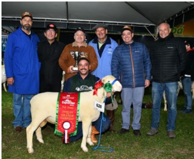
Reservado de Grande Campeão Rancho Miguel 439