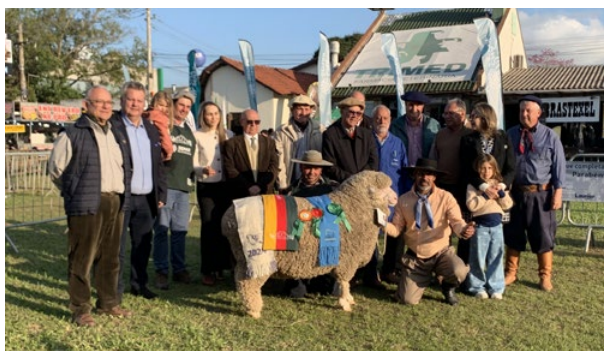
Grande Campeã Ideal