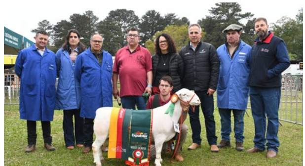
Grande Campeão White Dorper