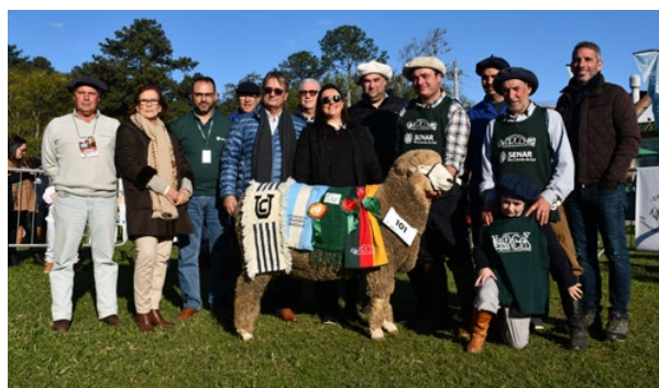
Grande Campeão Corriedale