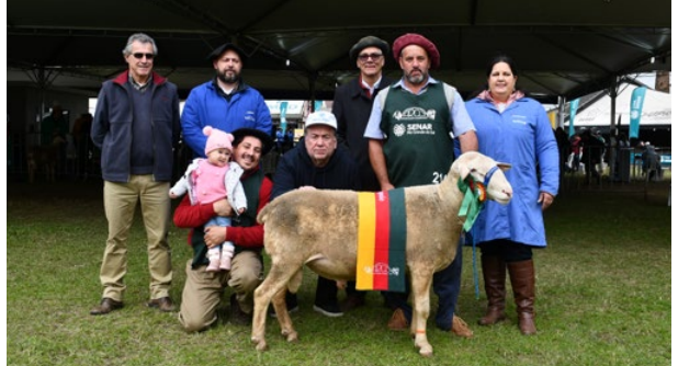
Grande Campeão Lacaune