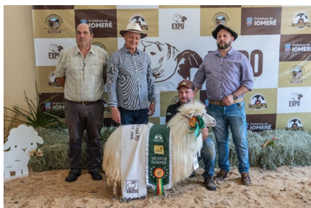
Grande Campeã PO: Sobrado Branco 397 Cabanha La Guerrera