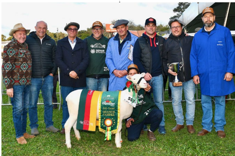
Grande Campeã Reserva Cambará TE 202

Terceiro Melhor Macho: RANCHO MIGUEL 424, Rancho Miguel