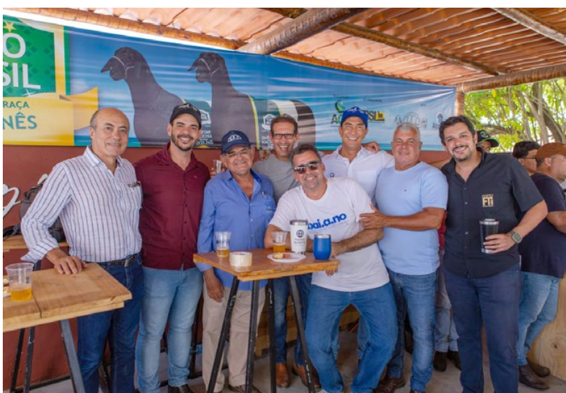
A raça Santa Inês demonstrou sua força e potencial por todo o Brasil em 2024, especialmente na 24ª Nacional realizada em outubro

SIL, mais uma vez conquistamos números crescente e chegamos a 650 animais inscritos para julgamento com mais de 560 animais julgados e 47 expositores de todo nordeste além de São Paulo. Foram 8 dias de confraternização, aprendizados e negócios. As 34 categorias do julgamento mostraram a evolução e qualidade atual do Santa Inês, categorias com mais 30, 40 animais disputando com muita homoge-