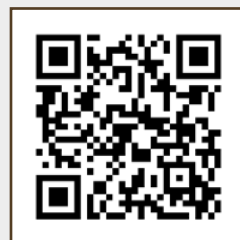
Carne ovina e seus usos na culinária