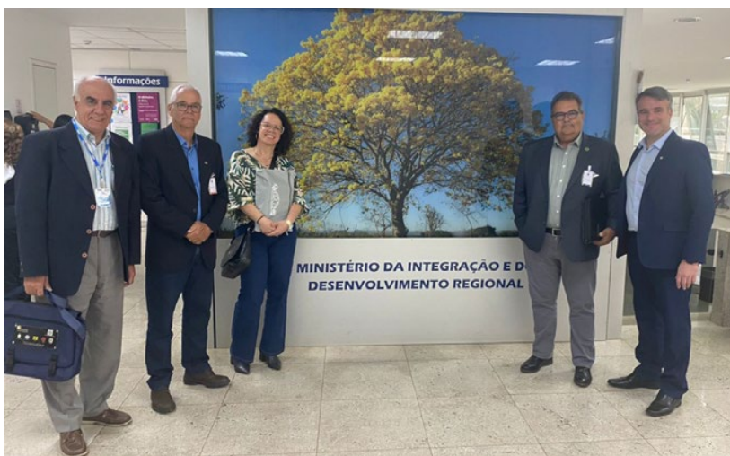
Representantes da Arco no Ministério da Integração e do Desenvolvimento Regional

Outra questão foi esclarecer pontos para viabilizar exportações de