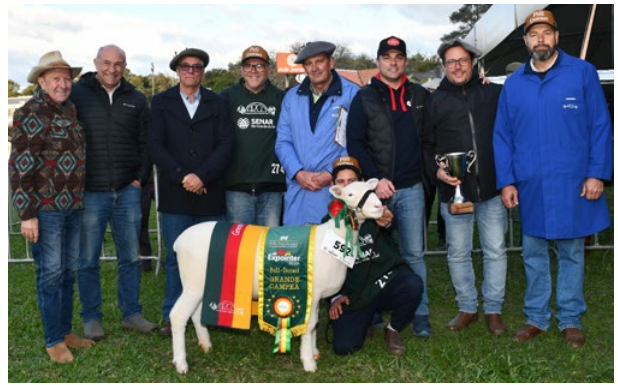
Grande Campeã Poll Dorset