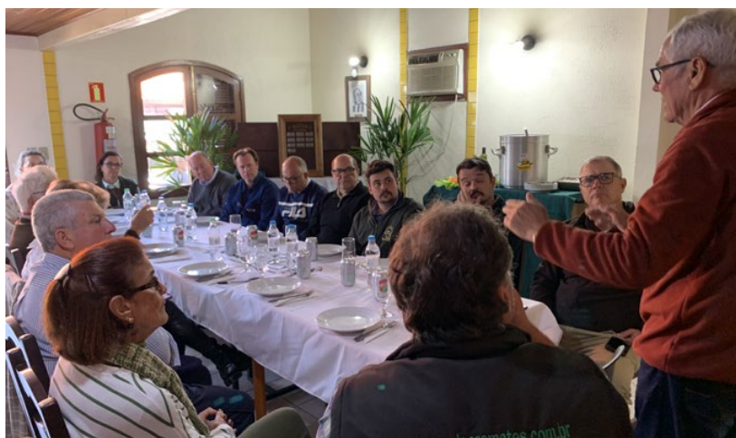
Almoço com representantes de Associações de raças