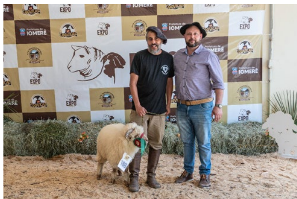
Campeão Ovino Do Futuro PO: Guerreiro Campos Cangucu 02 Criadeiro Guerreiro Dos Campos