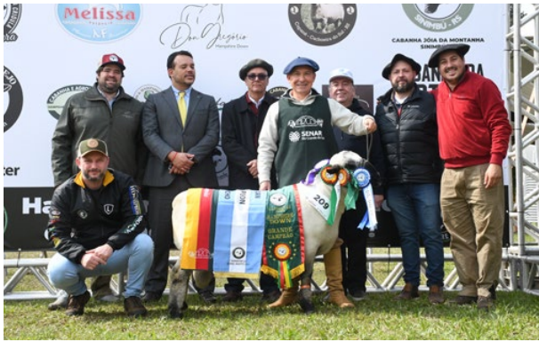
Grande Campeão Hampshire Down