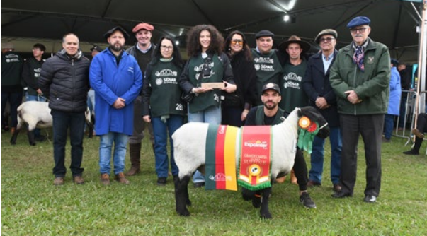
Grande Campeã Suffolk