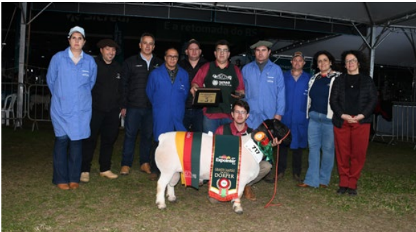
Grande Campeão Dorper