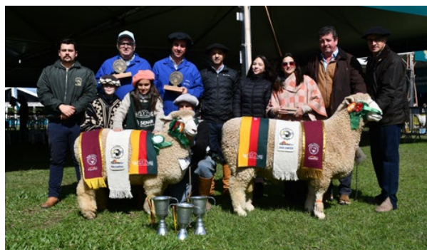
Grande Campeão e Grande Campeã Romney Marsh