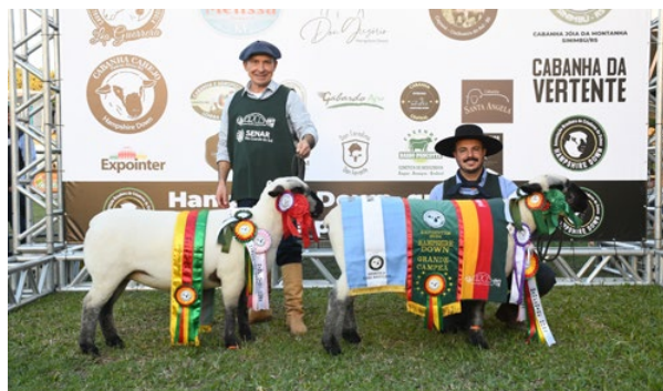
Grande Campeã Hampshire Down