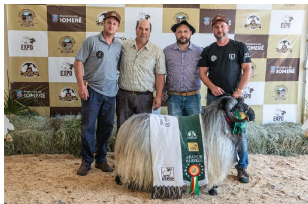
Grande Campeão Po Sanga Do Areal Espinilho 21 Cabanha La Guerrera