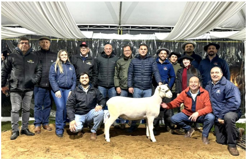
Destaque do Leilão Fêmeas, valorizada em R$60.000,00