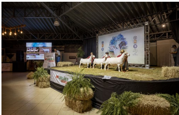
Leilão Selection: média de R$ 26.408 por animal