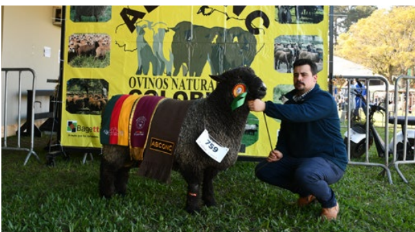
Grande Campeão Romney Marsh NCO