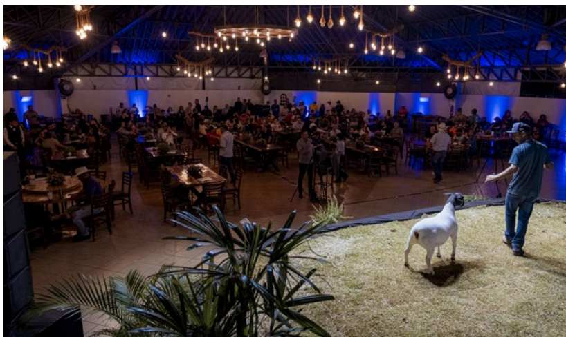
Evento aconteceu no Parque de Exposições Granja do Torto, em Brasília/DF

Outro aspecto que merece destaque do evento, segundo Boechat, foi a participação de diversas cabanhas que nunca haviam participado de uma Exposição Nacional das Raças Dorper & White Dorper, em grande parte devido à localização dos eventos anteriores. "Estando no Centro-Oeste, conseguimos atrair uma quantidade significativa de animais e de criadores. Portanto, essa ampla participação também se destaca, bem como o apoio que recebemos de estudantes de faculdades de Medicina Veterinária do Distrito Federal, o que foi fundamental para o bom andamento do evento", afirmou.