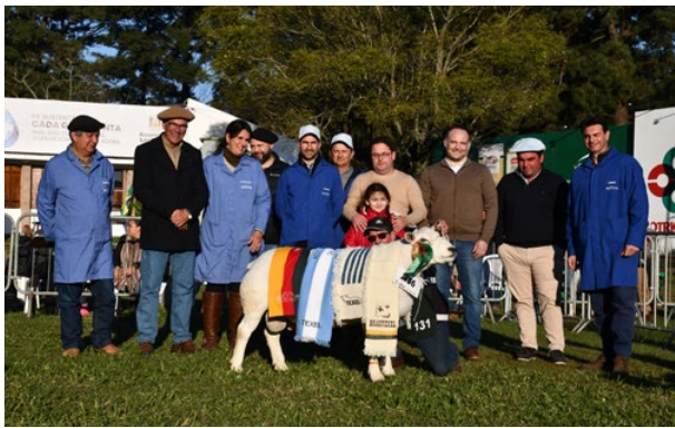
Grande Campeão Texel