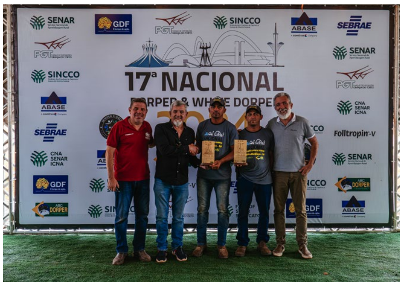
Cabanha Dorper Dom Miguel, Melhor Criador e Expositor da Raça White Dorper