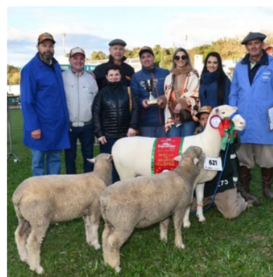
Reservada de Grande Campeã Silêncio 121