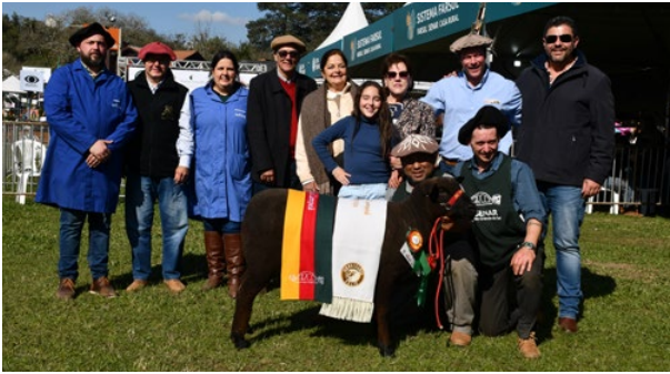
Grande Campeã Ile de France NCO