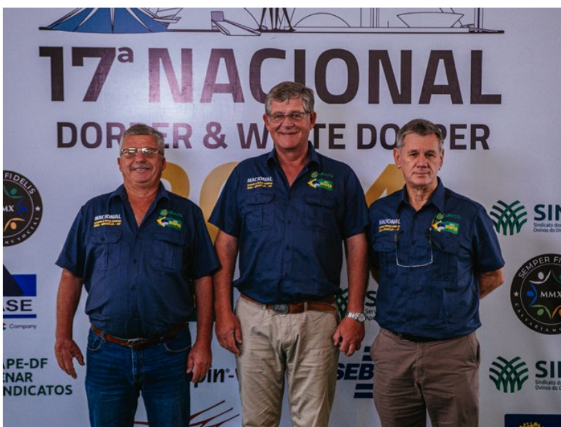
Jurados da 17ª Nacional das Raças Dorper & White Dorper

raças, que se destacam por suas contribuições à ovinocultura nacional. O Brasil está se posicionando entre os três maiores criadores do mundo, apresentando um excelente padrão racial", concluiu Pedro Rocha, presidente da ABCDorper.