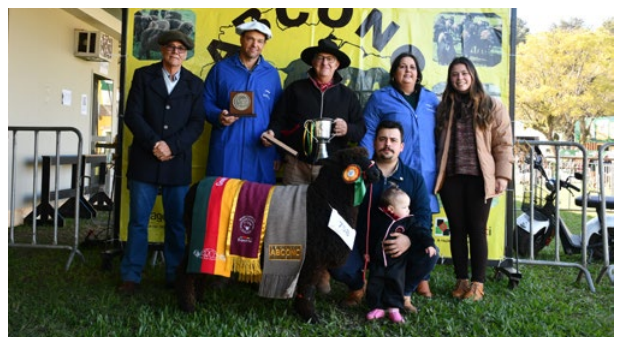
Grande Campeã Romney Marsh NCO